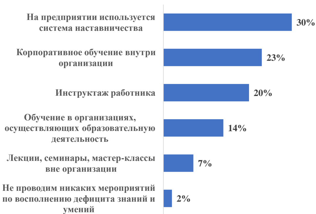
Рисунок 1. Какие мероприятия по восполнению дефицита профессиональной подготовки/компетенций работников, принимаемых на работу, проводятся в Вашей организации?» (в % от ответивших, без затруднившихся ответить)

Для квалификации «Работник почтовой связи» и «Оператор почтовой связи» работодатели отрасли в равной степени используют все виды мероприятий по восполнению дефицита профессиональной подготовки/компетенций работников, принимаемых на работу в организацию.