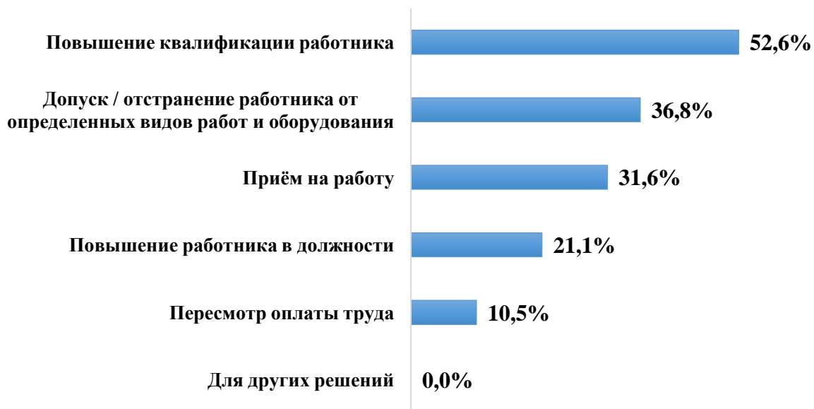
Рисунок 6. Распределение ответов на вопрос «Как Вы используете / Для принятия каких решений Вы могли бы использовать результаты независимой оценки квалификации? (в %)»

При этом работодатели отмечают, что могли бы использовать результаты независимой оценки квалификации для принятия решений.