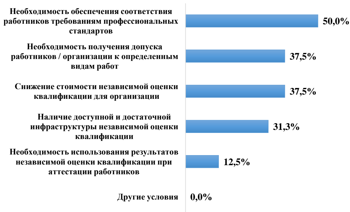
Рисунок 7. Распределение ответов на вопрос «Что может ускорить принятие решения о направлении работников на независимую оценку квалификации? (в %)»