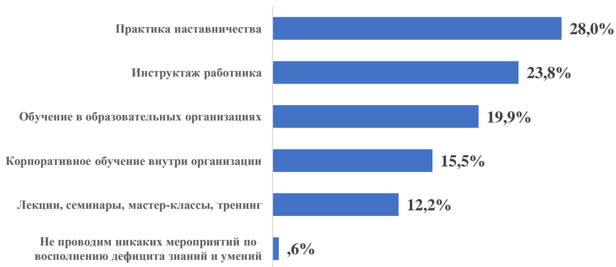
Рисунок 5. Распределение ответов о практиках по восполнению дефицита знаний и умений работников (в целом, %)

Наиболее распространённые практики дополнительного обучения, используемые для работников различных квалификаций: