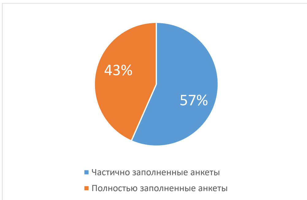
Рисунок 1. Полнота заполнения организациями анкет (в %)

Всего по отрасли связи было получено 159 анкеты от 82 предприятий, 69 полностью заполненных анкет.